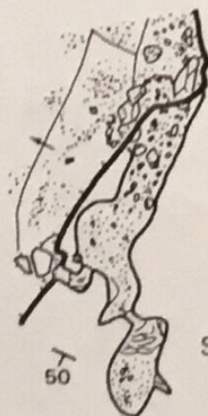
Salle de la Princesse