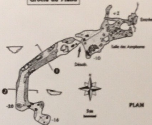
Grotte du Maou

Une descente de 2m amène dans une petite poche suivie d'un plan incliné terreux. Vers la droite, une diaclase de 5m permet de remonter à +2m. A gauche, un passage bas précède une descente qui aboutit dans une salle spacieuse, la Salle des Amphores, elle mesure 15m de long sur 5 à 8m de large et 2 à 4m de haut. Elle comprend deux diverticules vers l'amont, un vers le nord et l'autre vers l'est. Le fond est à -10m. Au fond sur la droite, au milieu de vieux piliers concrétionnés, un passage étroit agrandi annonce la suite qui est en fait la suite logique de la salle, sous la forme d'une galerie typique du karst du Plateau de Lacamp. Elle présente un profil caractéristique avec son plafond plat et ses talus boueux (voir sections). D'abord NE/SW, elle s'infléchit ensuite vers le sud où elle s'achève à -20m sur un colmatage argileux. Derrière, des passages étroits dans la concrétion permettent d'avancer d'une quinzaine de mètres mais on doit considérer ce morceau plutôt comme un ancien affluent.