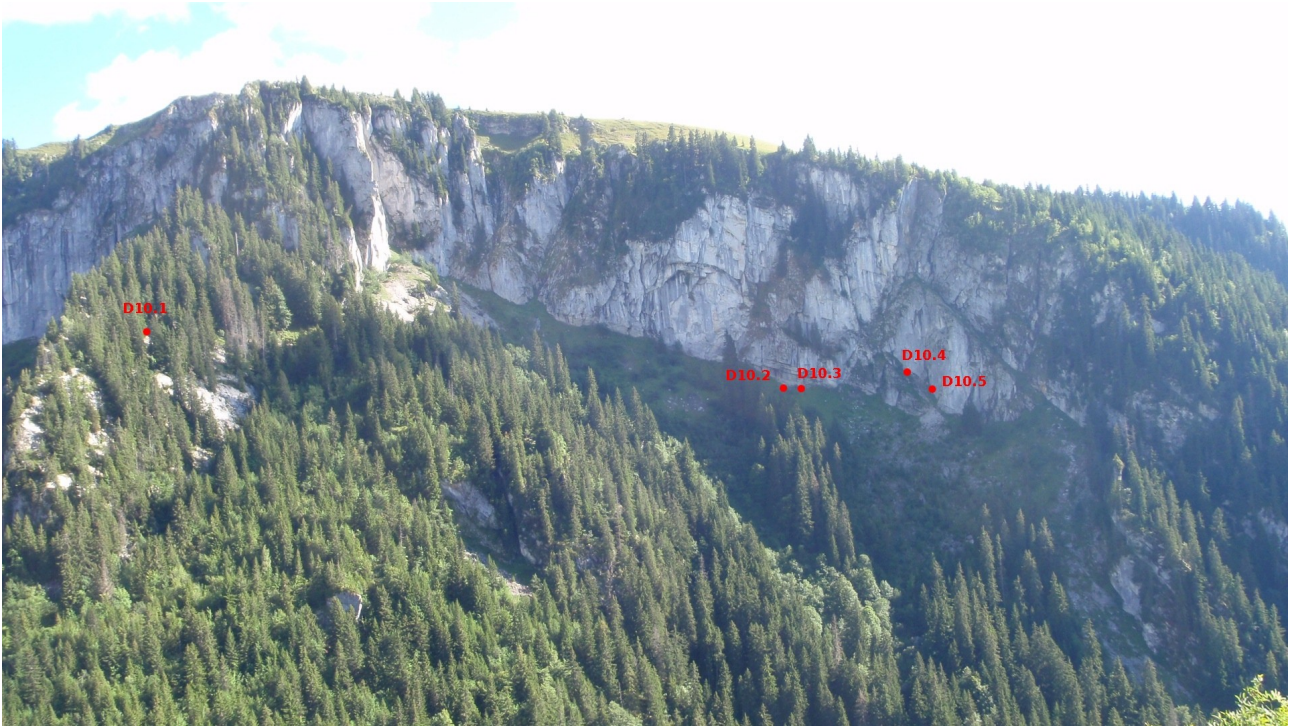
Illustration 15: Situation des grottes marquées.