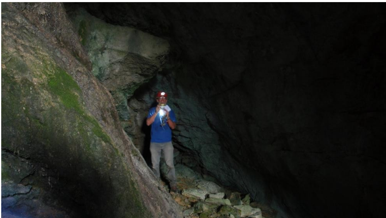
Illustration 10: Dans le D10.4

En continuant nous sommes arrivé sur un cône de déjections avec des indices de ruissellement. A l'amont de ce cône, il y a une belle ouverture qu'on décide d'aller voir. C'est le D10.4, qui est une assez grande salle qui mériterait une petite désobe dans le fond! (voir photos)