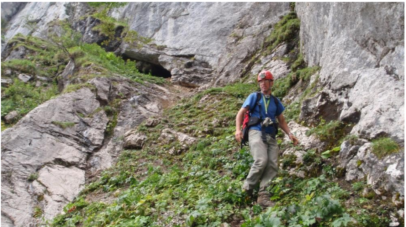
Illustration 9: En haut à gauche le D10.4