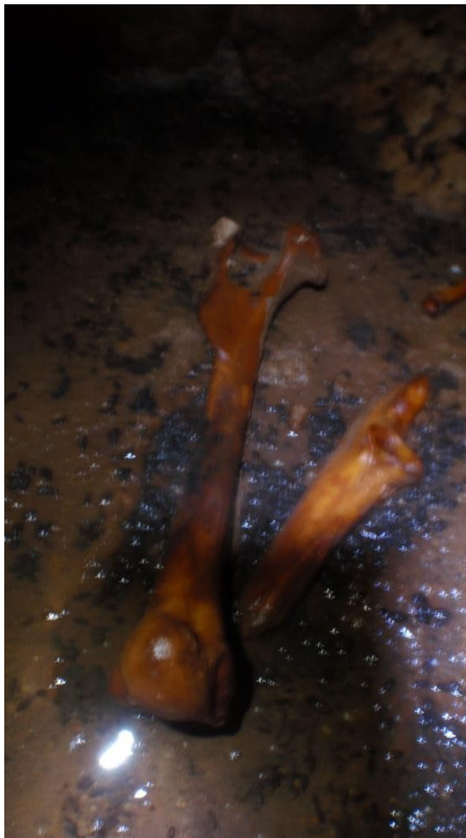
Illustration 5: Un gros nos!