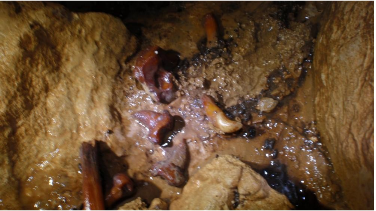
Illustration 4: Les dents de la bêtes inconnue!