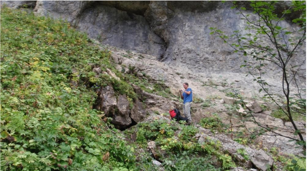
Illustration 8: Le D10.2 à gauche de Fréd.

On rejoint ensuite la parois du cirque qu'on longe en descendant. Sur le chemin on trouve le D10.2 qui est un trou soufflant obstruée par de la terre, donc désob facile et prometteuse. Pas très loin on trouve un autre trou le D10.3 qui n'est qu'une simple baume sans grand intérêt.