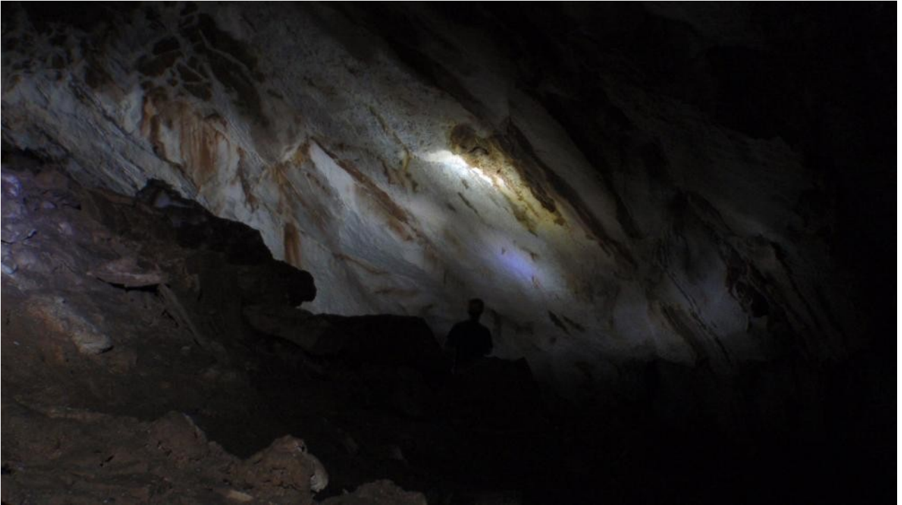
Illustration 6: Une photo de la salle.