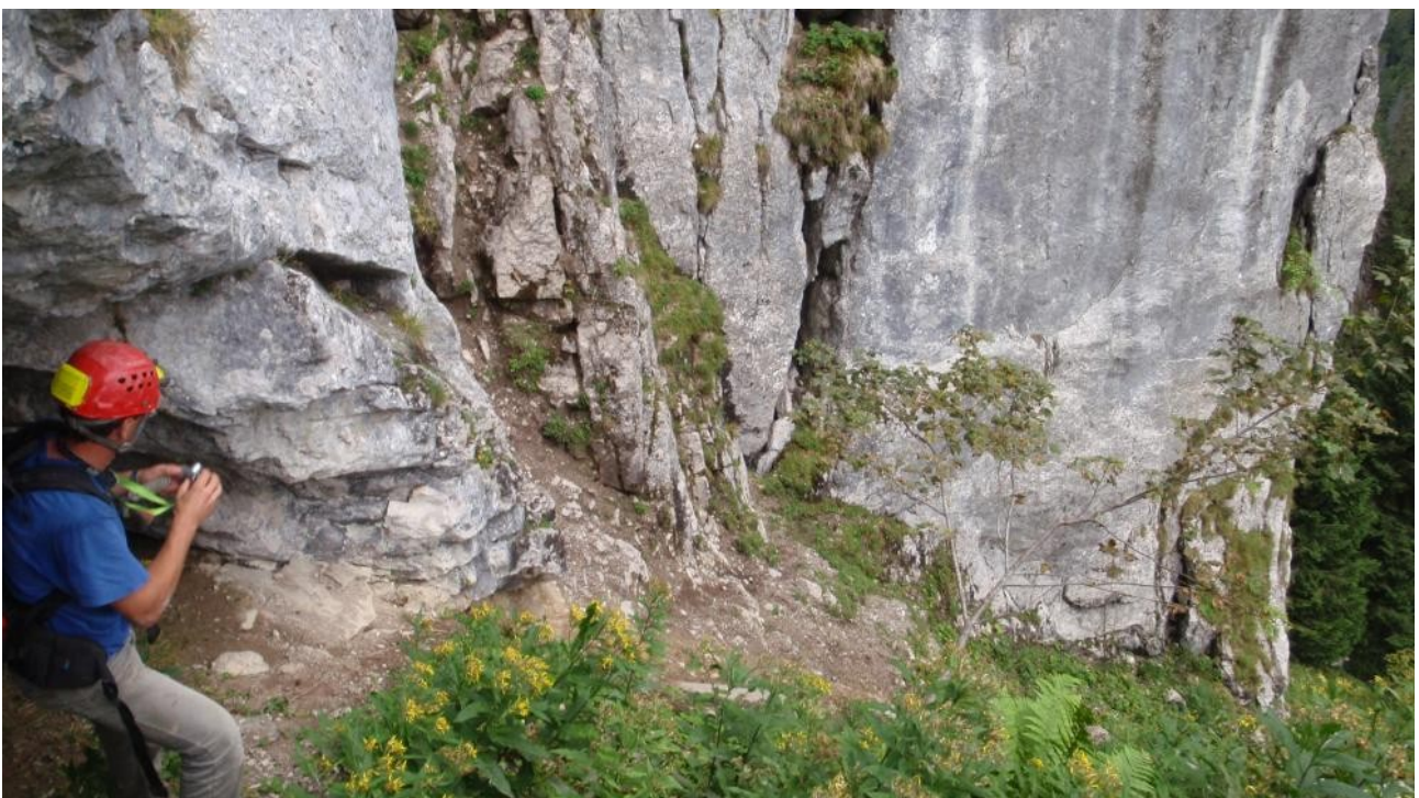
Illustration 13: Au milieu de la photo un peu à droite le D10.5

Mais en montant en direction du D10.4, on est arrêté par un courant d'air froid! Il provient d'une faille. L'entrée est donc une faille dont l'ouverture est à taille humaine et de plus de 3 m de haut et 0.7 m de large. Ca débouche tout de suite sur un puits estimé à un dizaine de mètre qui est se passe bien avec une corde et allant dans la direction de la parois. Très intéressant donc et à revenir!