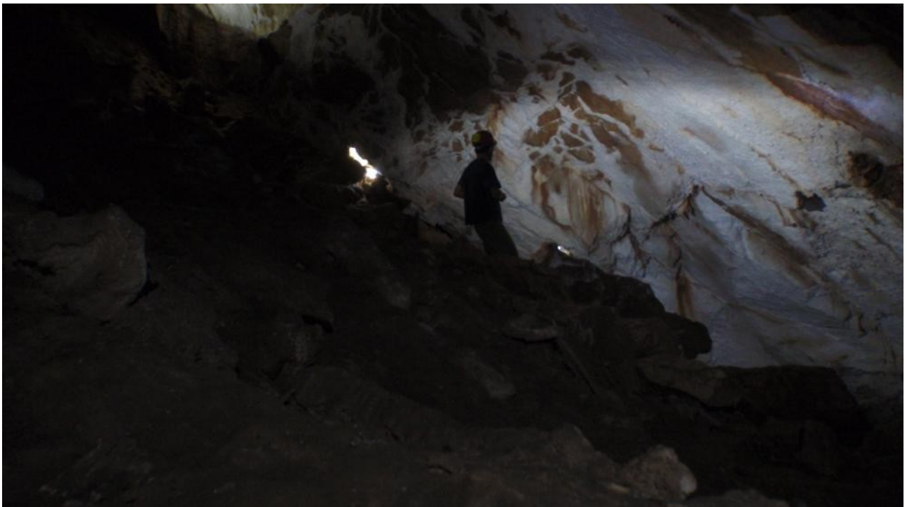
Illustration 7: Un autre photos de la salle...