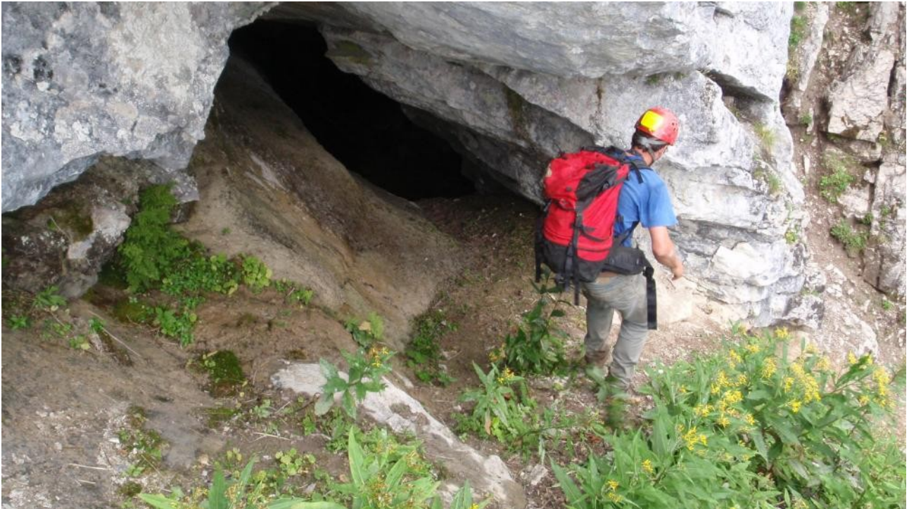
Illustration 12: Entrée du D10.4

Mais en montant en direction du D10.4, on est arrêté par un courant d'air froid! Il provient d'une faille. L'entrée est donc une faille dont l'ouverture est à taille humaine et de plus de 3 m de haut et 0.7 m de large. Ca débouche tout de suite sur un puits estimé à un dizaine de mètre qui est se passe bien avec une corde et allant dans la direction de la parois. Très intéressant donc et à revenir!