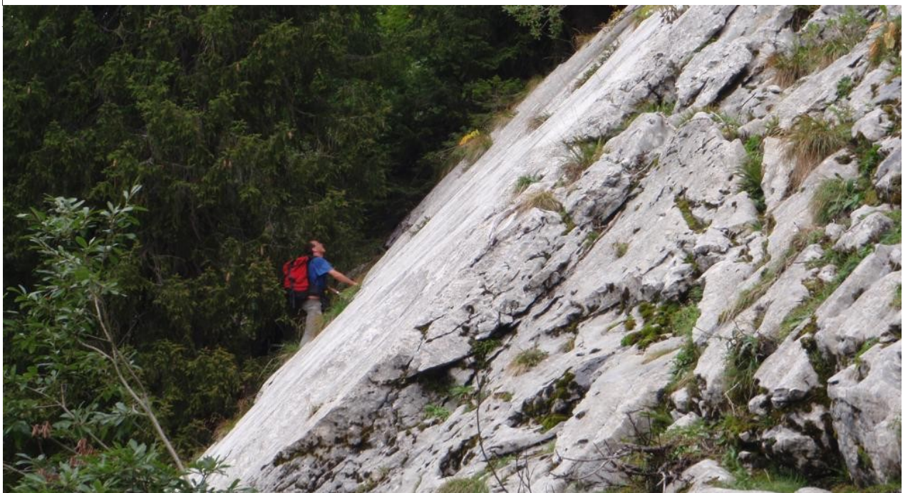
Illustration 2: Frédéric montant dans la dalle.